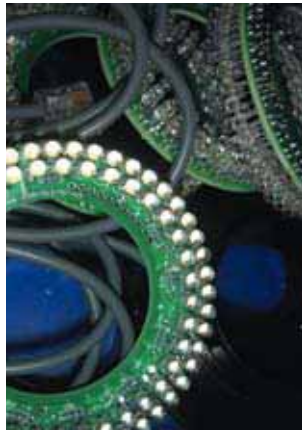
Eclairage de nouvelle génération avec diode LED.

Die Tischachsen sind manuell mit Hilfe von mikrometrischen Messfühlern einstellbar – es wäre schwierig, eine einfachere Lösung zu finden; nichtsdestoweniger werden die Bediener ausgebildet und regelmässig von den Fachleuten des Unternehmens besucht, um festzustellen, welchen Verpflichtungen sie nachkommen müssen. Dies ermöglicht dem Unternehmen ständig zu innovieren, um dem Bedarf perfekt angepasste Module anbieten zu können.